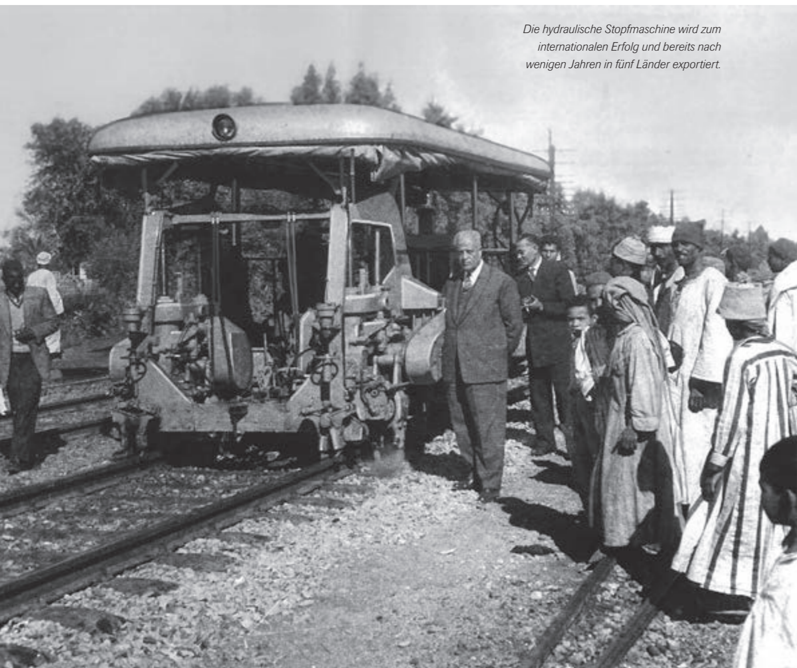
Die hydraulische Stopfmaschine wird zum internationalen Erfolg und bereits nach wenigen Jahren in fünf Länder exportiert.

Plasser & Theurer kann auf eine erfolgreiche Vergangenheit zurückblicken, doch investiert konsequent in die Zukunft.