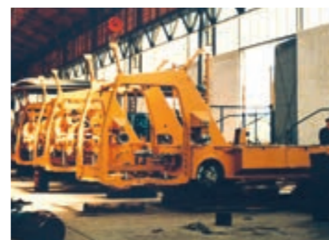
Beginn der Serienproduktion Mitte der 1950er-Jahre in Linz an der Donau, Österreich.