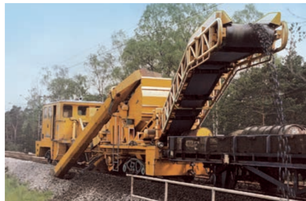
Bedarf für gleisgebundene Reinigung des Schotterbetts früh erkannt: 1963 nahm die erste vollhydraulische Bettungsreinigungsmaschine den Betrieb auf.

Plasser & Theurer kann auf eine erfolgreiche Vergangenheit zurückblicken, doch investiert konsequent in die Zukunft.